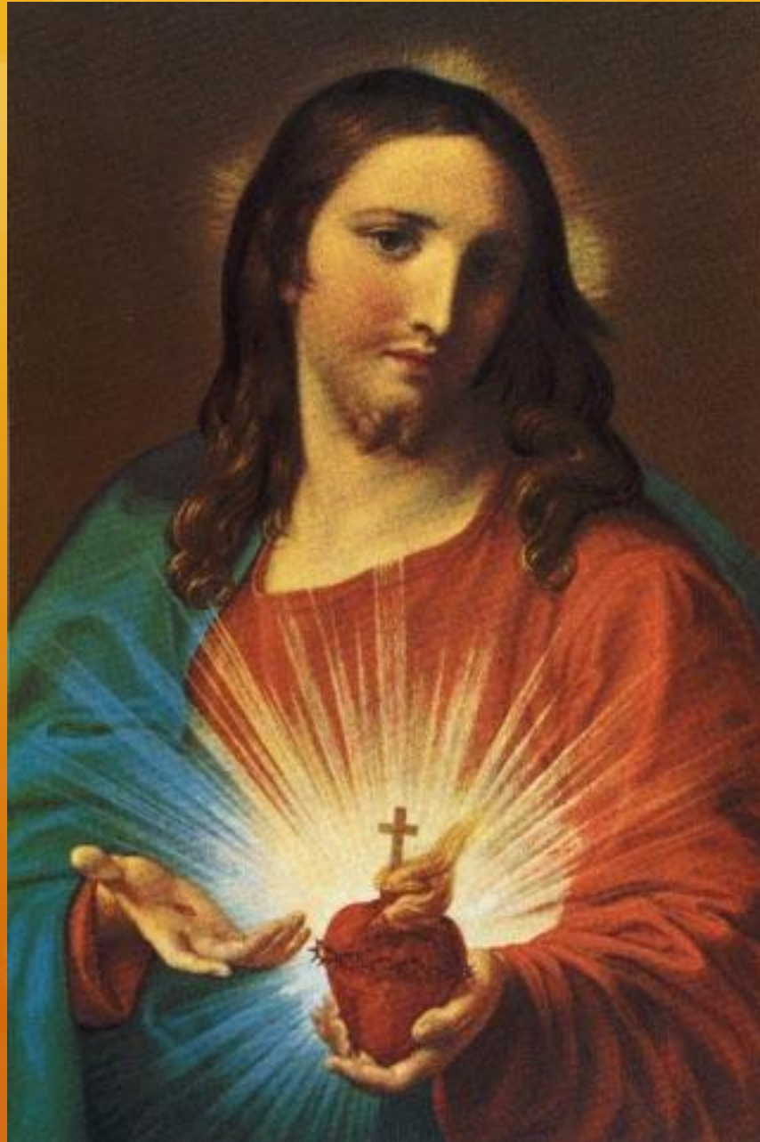
Pompeo Batoni, 1740

Burning bloodied heart, surmounted with cross and thorns